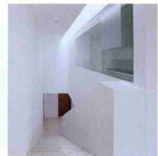
Mehrfamilienhaus Moussonstrasse, Zürich: Einzelgebäude mit offener Syntax.