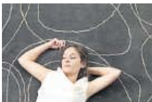
Hochwertig: Teppich von Rahel Felix.

Das Schweizer Design-Team von Rahel Felix wartet wieder einmal mit aussergewöhnlichen Teppichmustern auf. Im Zentrum stehen dabei die über Jahrtausende vom Wasser geschliffenen Kieselsteinformen, welche die Urkraft der Natur symbolisieren. In liebevoller Handwerksarbeit und aus hochwertigen Materialien hergestellt, sind die Produkte nun im Handel oder unter www.rahelfelixdesign.com erhältlich.